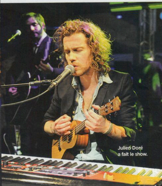
Julien Doré a fait le show.