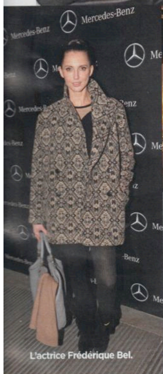
L'actrice Frédérique Bel.